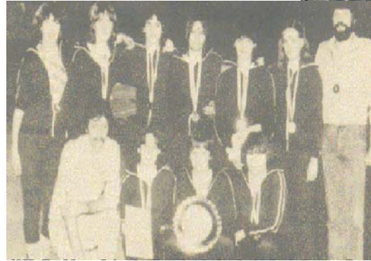
1983: Bezirksmeister Der Berufsschulen im Volleyball