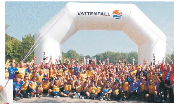
2003: Siegermannschaft mit dem errungenen Pokal