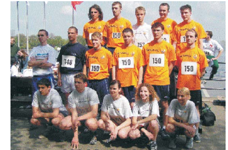
Starter 2004 beim Alsterlauf