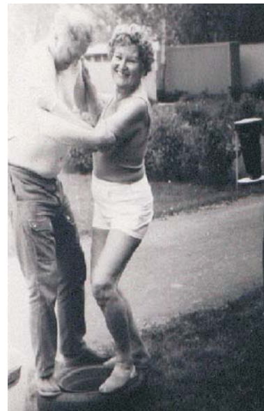
Reifenwechsel im Doppelpack