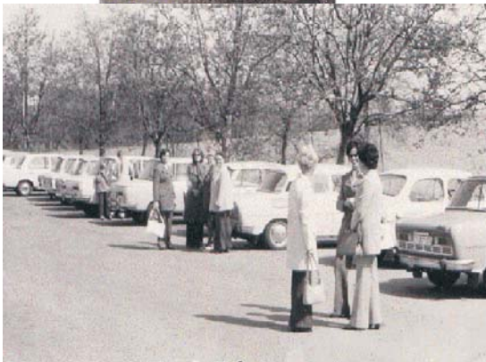
Zwischenstation mit 1. Auswertung