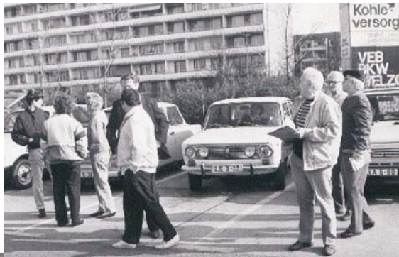
Letzte Instruktionen vor der Ausfahrt