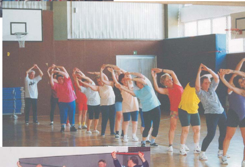
Trainingsgruppe WK 10