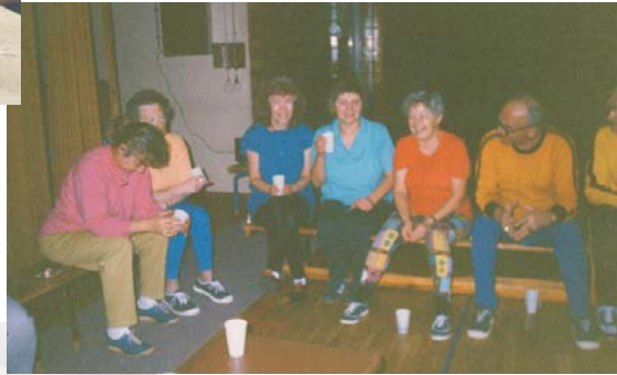
1993: Seniorensportgruppe - nach der Übungsstunde