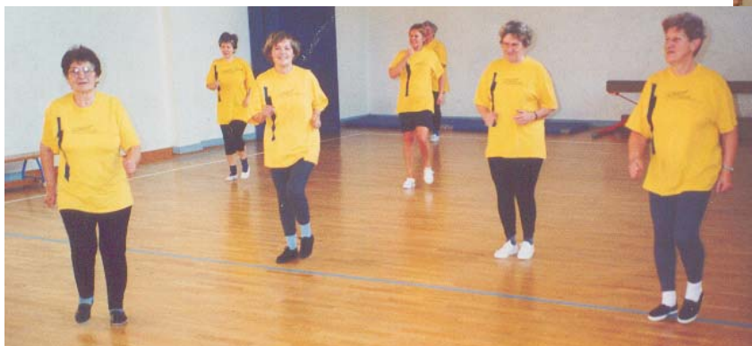
Trainingsgruppe WK 2