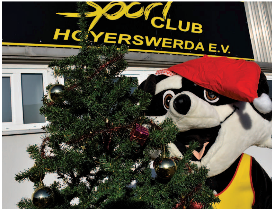
Auch wenn die gemeinsamen Trainingsstunden coronabedingt weiterhin ausfallen, will das Trainerteam den Zusammenhalt unter den Sportlern fördern - mit einem »Bewegten Adventskalender« und dem Erlaufen von gemeinsamen Gesundheitskilometern. Das Sportclub-Maskottchen freut sich schon darauf.

Schon ist sie da, die Weihnachtszeit, die Kerzen scheinen weit und breit. Geschenke werden hübsch verschnürt und ein jeder wird von Leckereien verführt. Damit es nicht im Rücken knackt und sich der Weihnachtsschmaus nicht auf die Hüften packt, hält der Sportclub Hoyerswerda in dieser etwas anderen Weihnachtszeit etwas Tolles für alle bereit.